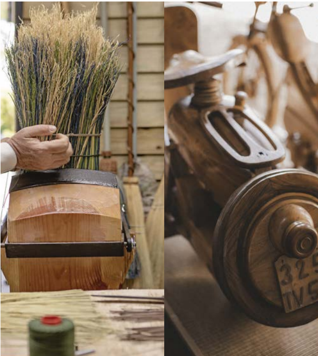
1 - La Visite Guidée de l'Atelier et de l'exposition l'Art du Bois