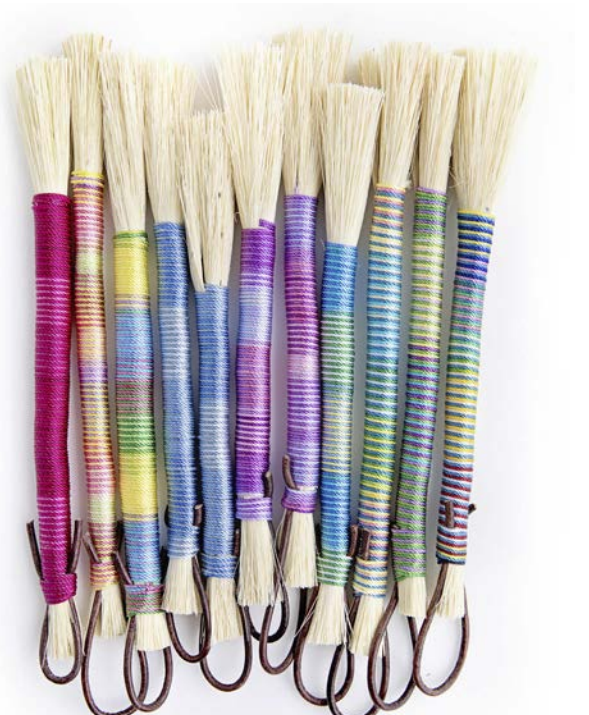
2 - La Fabrication d'une Balayette pour Ordinateur