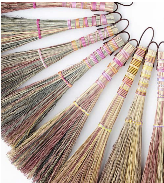
3 - La Fabrication d'une tapette à mouches