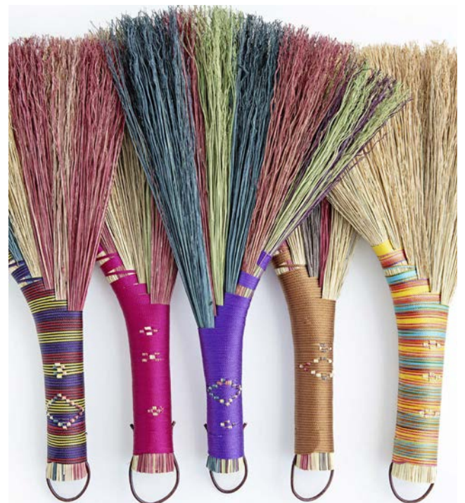
4 - La Fabrication d'une Balayette Cheminée